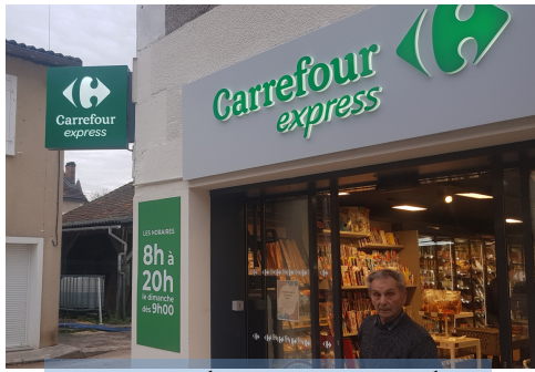
Le 23 Octobre inauguration du Carrefour Express un moment important dans le quotidien de la commune.