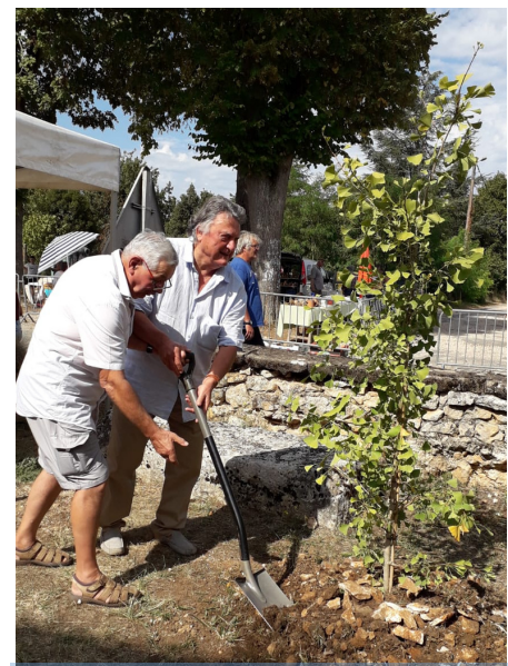
A l'occasion des 200 ans de mariage entre les communes de La Chapelle St Robert et Javerlhac plantation d'un olivier et d'un GINKGO BILOBA arbres de la paix