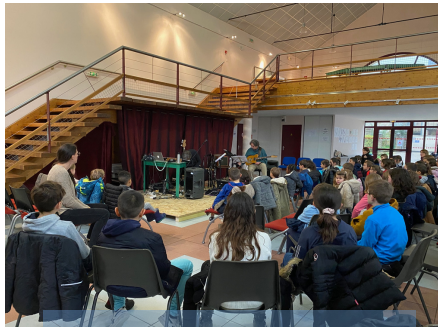
Clavicorde offre un concert aux écoliers le 27 novembre