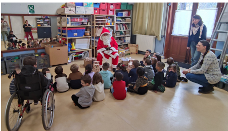
Noël de l'école