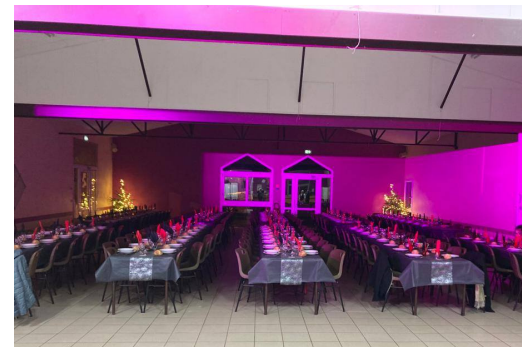
Le Comité des Fêtes a comblé les 170 convives lors du réveillon de la St Sylvestre