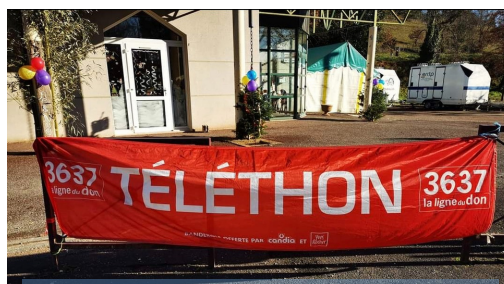
TÉLÉTHON organisé par l'association AMIGYM : un vif succès