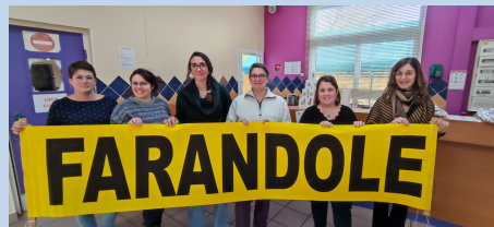
Farandole : vide ta chambre et vente de crêpes

Exemple d'un week-end animé et éclectique 25 et 26 novembre