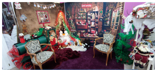
Marché de Noël organisé par le Comité des Fêtes et Farandole