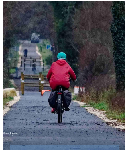
Flow Vélo il faut être fier de cette infrastructure qui valorise notre Périgord Vert